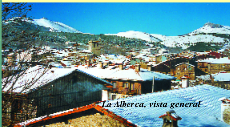
La Alberca, vista general

En el recorrido por el pueblo llama la atención la incomparable Plaza Mayor con soportales y la Iglesia edificada en el siglo XVIII con su esbelta torre que data del siglo XVI, dentro de la iglesia puede admirarse un bello púlpito policromado de piedra berroqueña del siglo XVI entre otras obras de arte.